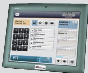
Touch Panel PC 8 Zoll/Intel N270/ mit Microsoft® XP Embedded